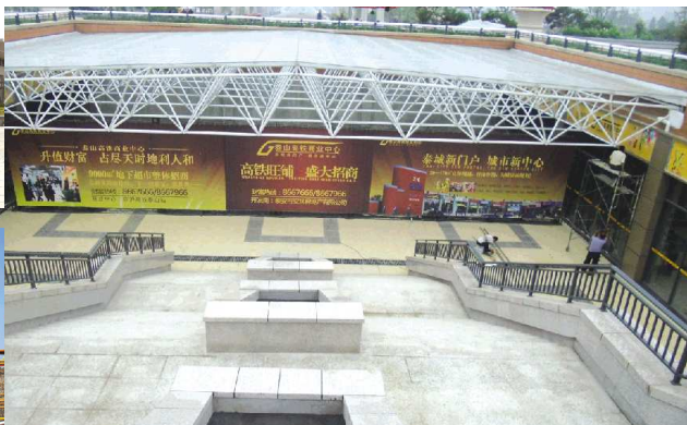
▲高铁泰安站人防工程建设完毕。