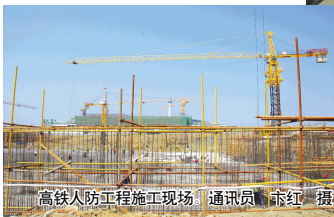
高铁人防工程施工现场