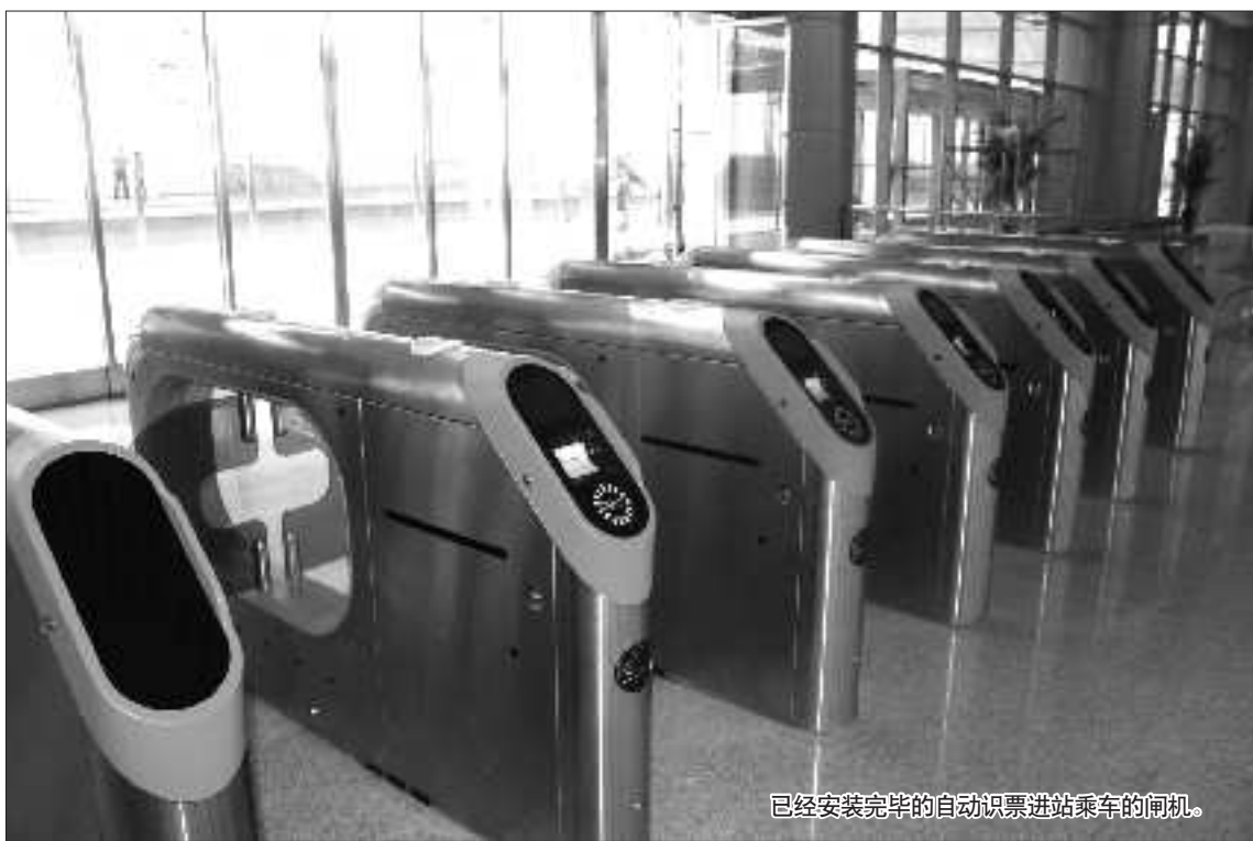
已经安装完毕的自动识票进站乘车的闸机。

正式运行后首趟停靠枣庄站的列车将是7点56分到站的由济南西发往杭州的G51,截至到30日中午12点,此趟列车共售出83张车票。