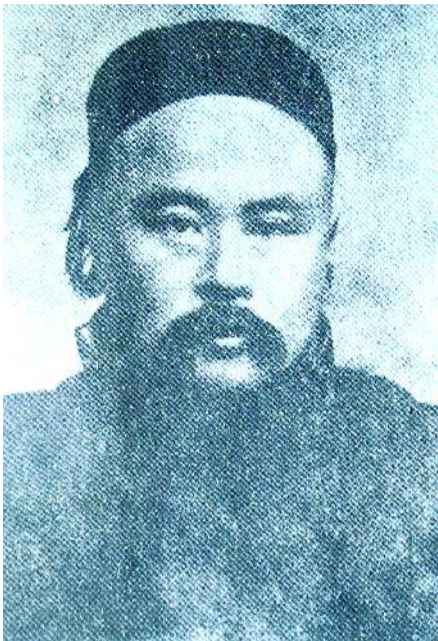
刘鹗与他的《老残游记》