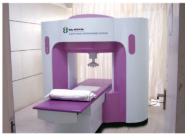
▲场效消融射频聚焦治疗仪