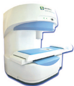
▲体外短波多功能治疗仪

作关系,对平时遇到的疑难病例,随时通过互联网进行远程会诊,有效加快了医院业务的建设。同时,医院还常年聘请全国著名的老专家、老教授为技术顾问,定期到医院坐诊。促使潍坊市男科发展水平及蓝天医院男科疾病的诊疗实力又迈上了一个新的台阶。