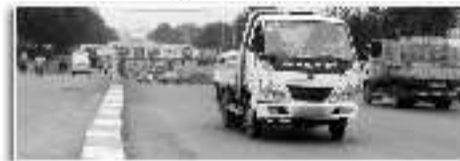
▲潍州路的通行现状。