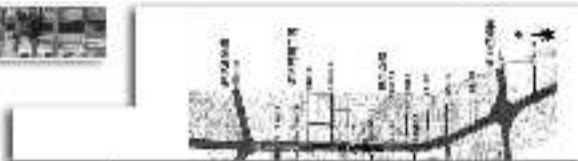
▲拓宽工程将从健康街以南开始，至潍胶路。

本报7月18日讯(记者 郑雷 通讯员 刘以文)18日,记者从奎文区住房与城乡建设局了解到,潍州路拓宽工程已正式启动,从健康街至潍胶路7.6公里的潍州路段,将拓宽至80米,届时潍州路段将成为潍坊一条最高标准的城市景观大道。