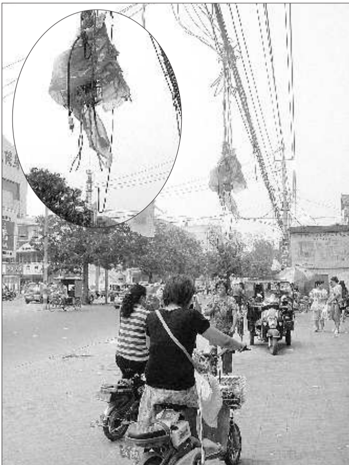
▲市民从东方红大街路边裸露的插板下经过,电线头距离行人只有20多厘米的距离。

菏泽市城市管理局工作人员告诉记者,对于路边垂下的电线,他们会督促供电公司进行处理;从路灯处私接电源有损市容市貌,他们也会予以干预;但从用电家庭中接电源则不在其管理范围内。