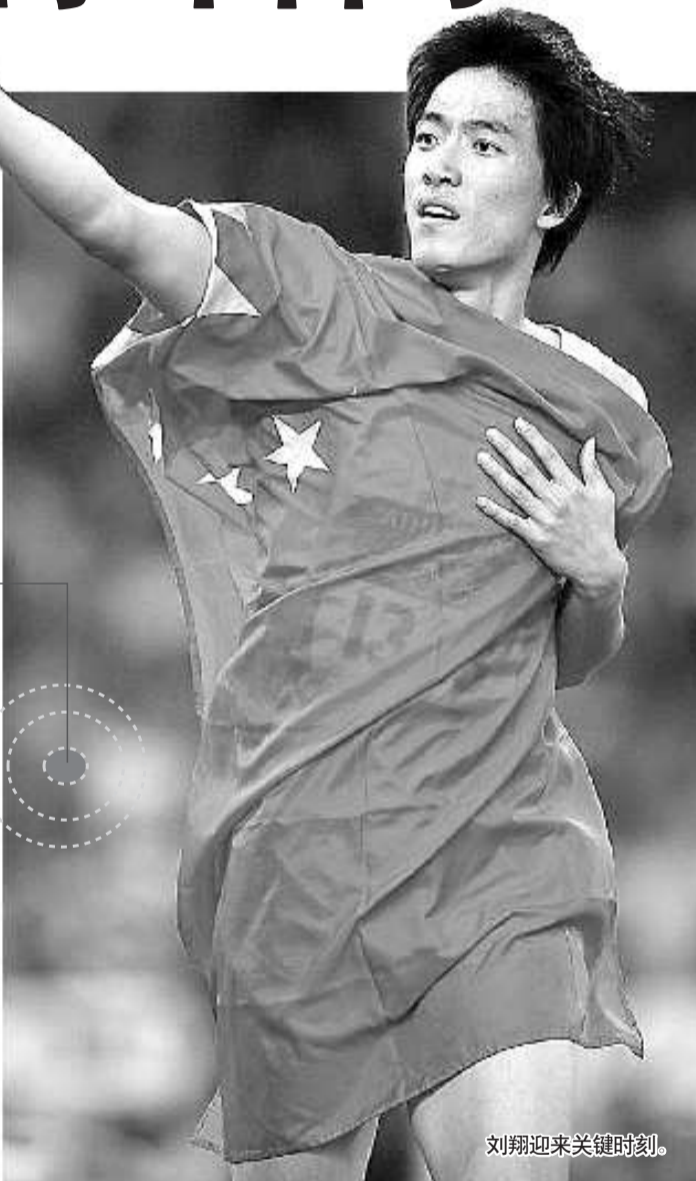
刘翔迎来关键时刻。

同为与水有关的项目,北京奥运会上中国选手在赛艇、皮划艇和帆船帆板等水上项目的表现令人惊艳。这些项目的选手想要进军伦敦,9月的赛艇世锦赛、8月的皮划艇世锦赛以及年底的国际帆联世锦赛将是抢票重头戏。