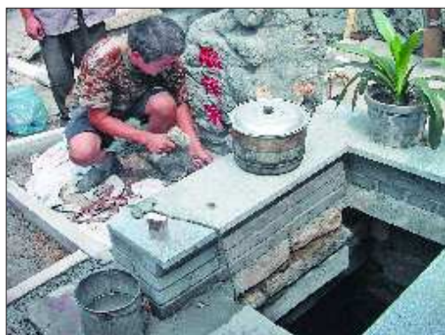
工人正在对院后泉及院落进行修缮。

“考虑到院后泉深藏在老城区四合院,这次修缮要在原有风貌上进行整修,体现泉水人家、市井风情的特色。”张兆瑞说,他们在动工前进行了专门的设计,考虑到老院落里下水道排水不畅,雨季会出现倒灌,工人们首先对下水道进行了整修。此后开始了塑泉池、铺