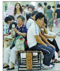
23日,在人防地下商场内,市民们坐在纳凉点的座位上休息。

据济南市气象台最新资料显示,预计24日到25日济南将迎来一次降雨过程,闷热天气会有所缓解。具体预报如下:23日夜间到24日白天多云转阴,24日早晨前后有轻雾;24日中