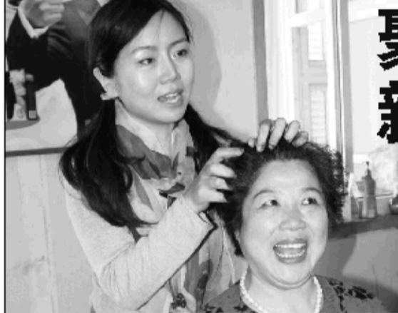
五贝子升级产品珍草堂植物染发剂按照国家 QS 安全标准生产，