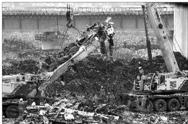
7月26日,吊车将事故现场的车头残片吊至大型运输车辆上。