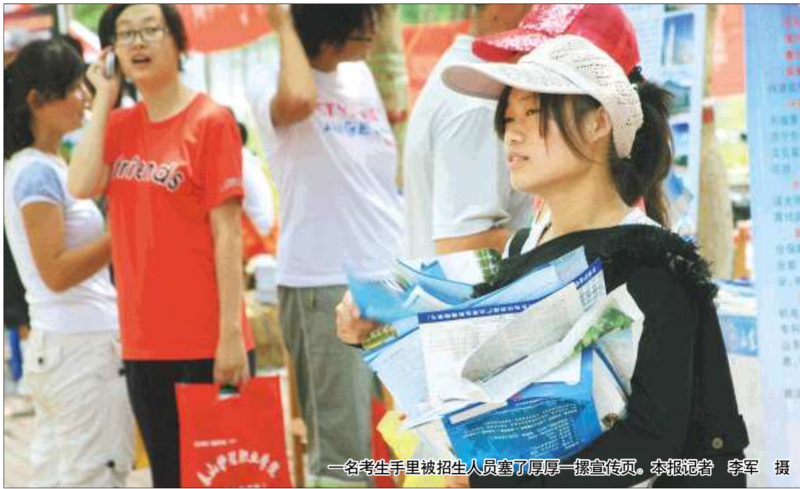
一名考生手里被招生人员塞了厚厚一摞宣传页。

记者在现场数了一圈,发现参加咨询会的学校有百余所,每个学校招生人员少的三人,多的也有五六人,但现场的学生却只有几十人。“我们6月初就来了,招了快俩月了。”一名招生人员表示,高考时招生大战就开始了,有潜力报考的学生已被挖的差不多了,来的学生少也很正常。