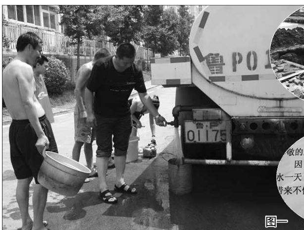
图一:水务集团的应急供水车送来一车水应急。

26日晚8点左右,记者再次赶到施工点,现场还在施工,工人说大概10点左右能完工。