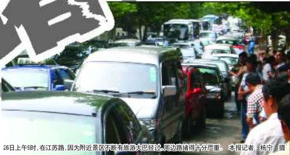
26日上午9时,在江苏路,因为附近景区不断有旅游大巴经过,周边路堵得十分严重。本报记者 杨宁 摄