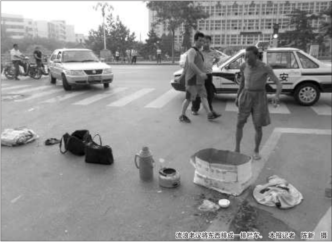
流浪老汉将东西排成一排拦车。

本报 96706 热线消息(记者 陈新 通讯员 郝波 李庆峰) 27 日晚,一智障青年醉卧奈河边。原来,26 日早晨,该青年遇上一名流浪老汉,跟着他来到奈河,俩人一见如故,一来二去喝醉了酒,在奈河东路大闹了一场。