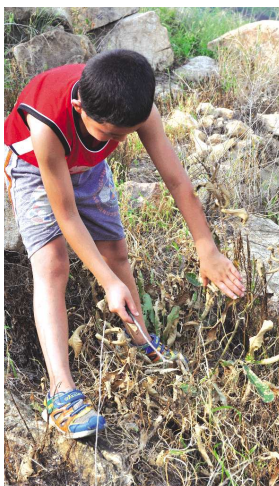
不起眼的地方,也丝毫不敢大意。