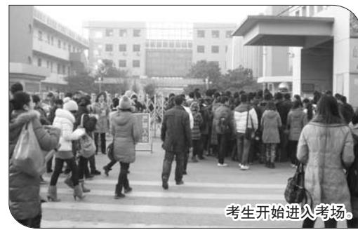
考生开始进入考场。

活动征集热线:0632--8880110 邮箱:jrzstk@163.com QQ:2650740341