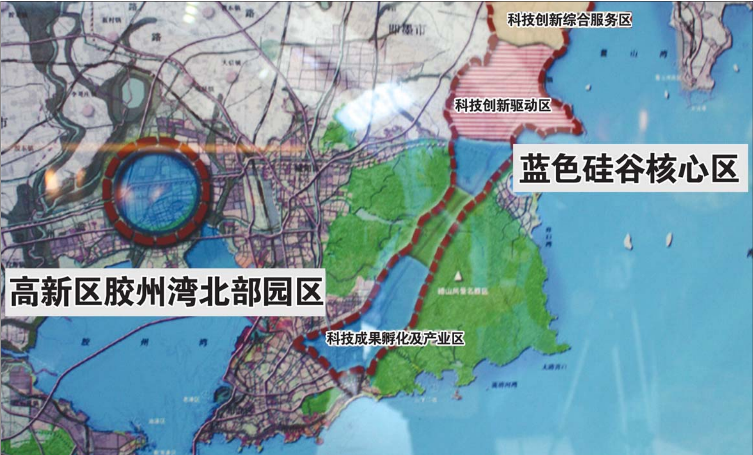
蓝色硅谷规划示意图。