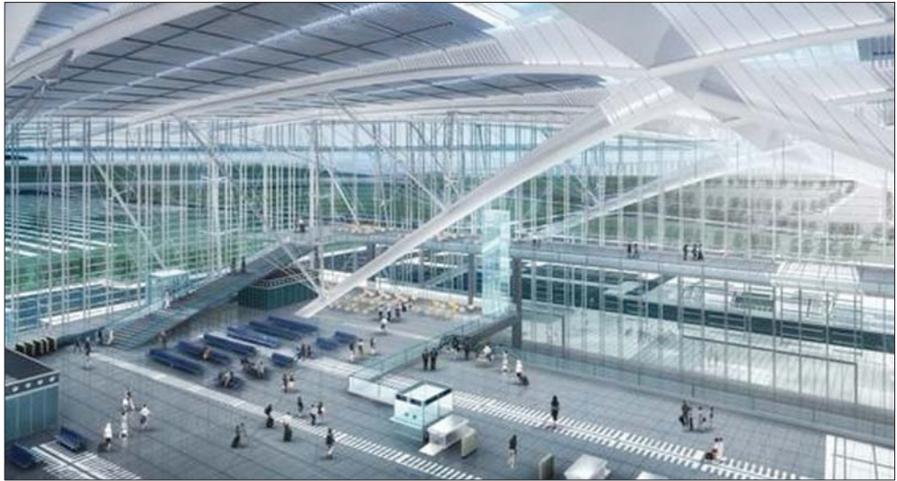
青岛火车北站效果图。