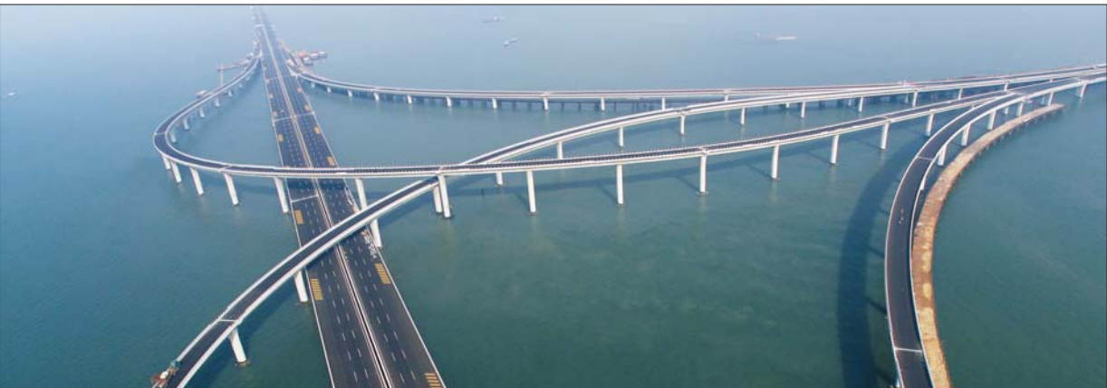
胶州湾大桥航拍。

现教育现代化,继续深化医药卫生体制改革,建立覆盖城乡居民的基本医疗卫生体系;落实全民健身计划,大力发展体育事业,提高全民健康水平,建设健康城市。完善社会保险制度,大力发展社会救助,社会优抚,社会福利和慈善事业,健全覆盖城乡的社会保障体系。维护社会和谐稳定,完善打防控一体化的社会治安防控体系,依法惩处各类犯罪活动,加强基层基础工作,不断增强公众安全感。大力推进阳光政法,加强执法监督,规范执法行为,强化法律服务,促进公平正义。加强食品药品生产和安全监管,防范金融风险,重视防灾减灾,健全突发事件预防预警和应急处置体系,提高公共安全保障能力。