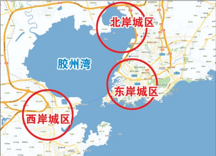
环湾三大主城区示意图。