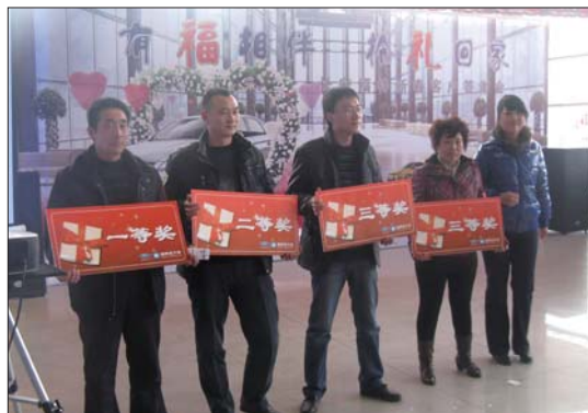
幸运客户在抽奖现场。

活动当天还设置了别开生面的订车抽奖环节,越早下订的客户获得大奖的机会就会更大:一等奖:价值3999元封釉+底盘装甲+4门贴膜+4轮定位+VIP金卡一张,数量2个;二等奖:价