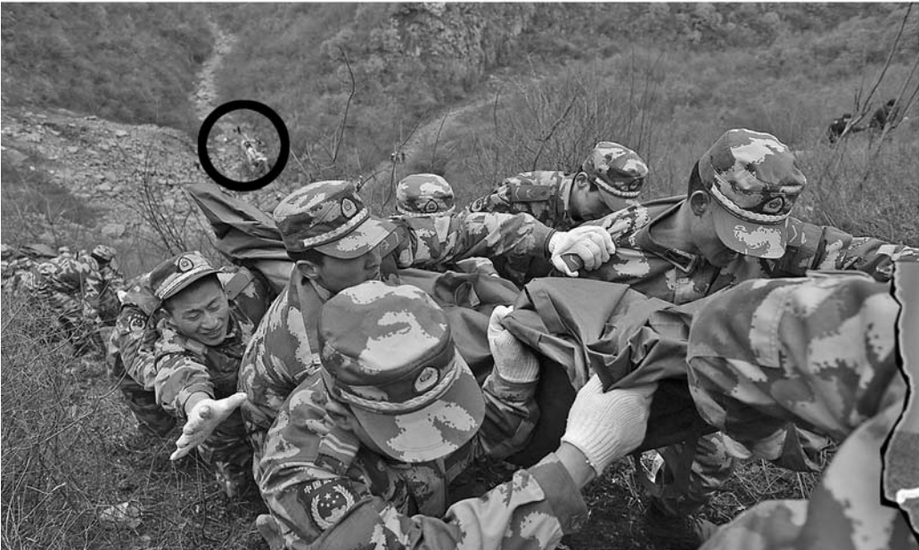
25日,救援人员在事故现场组织救援。图中圆圈内为坠入深沟的大巴。

本报综合消息 据山西省交警总队介绍,25日9时25分左右,河南三门峡市运输公司一辆旅游大巴,从山西晋城开往河南济源,在207国道高平段翻入约百米深的山沟。车上核载35人,实载34人。目前已有15人确认遇难,19名伤者已送往附近医院接受治疗。 在现场进行救援的晋城市红十字应急救援队志愿者告诉记者,有些死者身上的手机还一直响个不停,估计是家属正在寻找。 河南户外救援队义马分队负责人表示,伤亡人员均系河南三门峡市人,是自发组织的户外运动团队,在34名伤亡人员中,有3对夫妻,年龄最小的是一名8岁女童。 据介绍,事发前,河南三门峡驴友通过QQ户外群自发联络,形成包括司机在内的34人团队,约定于25日进行户外穿越活动。