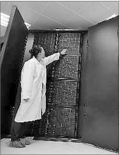
▲国家超级计算济南中心(资料片)

气候气象、石油勘探、生物信息、工业设计等领域开展了一些课题计算。 本报记者 邢振宇