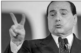
贝卢斯科尼(资料片)

据新华社电 意大利米兰一家法院25日裁定,由于诉讼时效已过,不追究前总理贝卢斯科尼所涉行贿案件。针对贝氏行贿英国税务律师米尔斯一案,这家米兰法庭已审理约5年,25日举行最后一场庭审,贝卢斯科尼本人没有出席。按检方的说法,贝卢斯科尼所涉行贿案的诉讼时效今年7月到期。