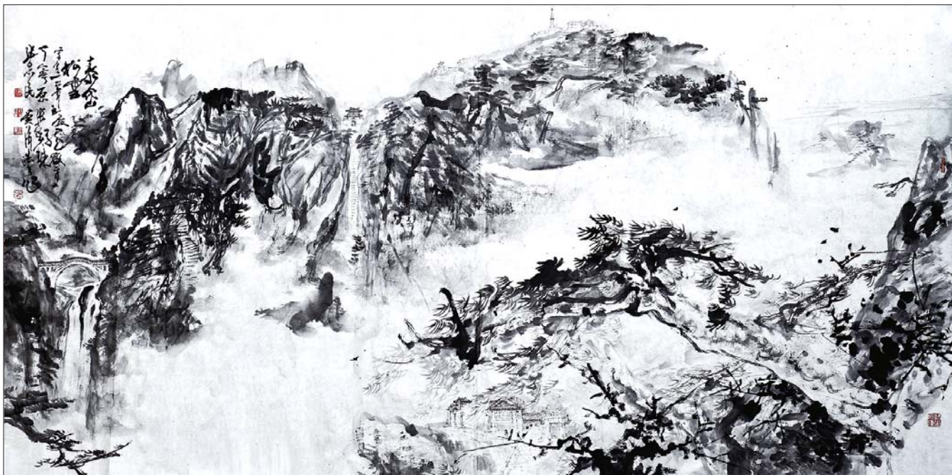
《泰岱松云》(8尺)丁宁原 吴泽浩 张宝珠 张志民合作