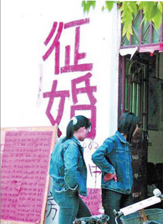
婚介所里水有多深? (资料片)

记者调查多家婚介所,大多数婚介并没有悬挂两证,有的婚介所只悬挂《民办非企业单位登记证书》,更有一些婚介所一个证也没有,就做起来交友、征婚的“买卖”。