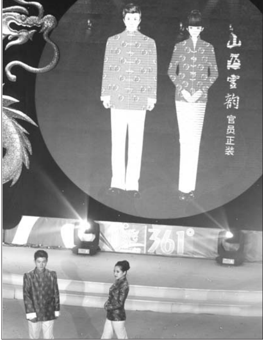
▲漂亮的“山海灵韵”服装。

(中国)有限公司完成。 海阳亚沙会运动会服装正装则包括唐装和礼仪服装,由亚奥理事会长期合作伙伴的广东大哥大集团设计制作完成。 海阳亚沙会礼服、正装制服设计灵感源于海阳的自然风光,海阳是一片美丽而神奇的土地,大自然赐予了她美妙的山海情韵,并以弘扬中国传统孔子文化的儒雅、和谐为设计主旨结合海阳的历史文化,突出此次亚沙会引领体育潮流回归自然的主题。共分为“山海灵韵”篇、“海韵阳光”篇、“海韵阳光”篇、“海韵阳光”篇、“凤舞海阳”篇与“碧海银沙”篇。