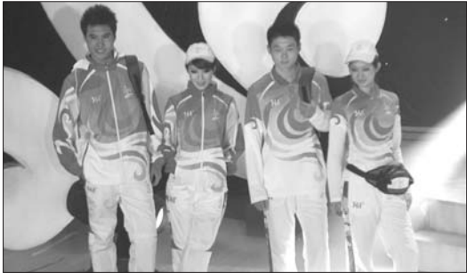
▲专业模特在晚会现场对服装进行精彩展示。