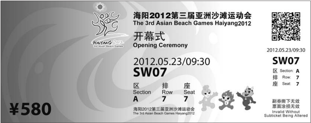
▲亚沙会的开幕式门票票样。

本届亚沙会门票实行低价位销售原则。开闭幕式门票最高价为2880元,最低价为120元;竞赛门票最低价为20元。6万多张门票将分阶段面向全球进行实时公开销售。