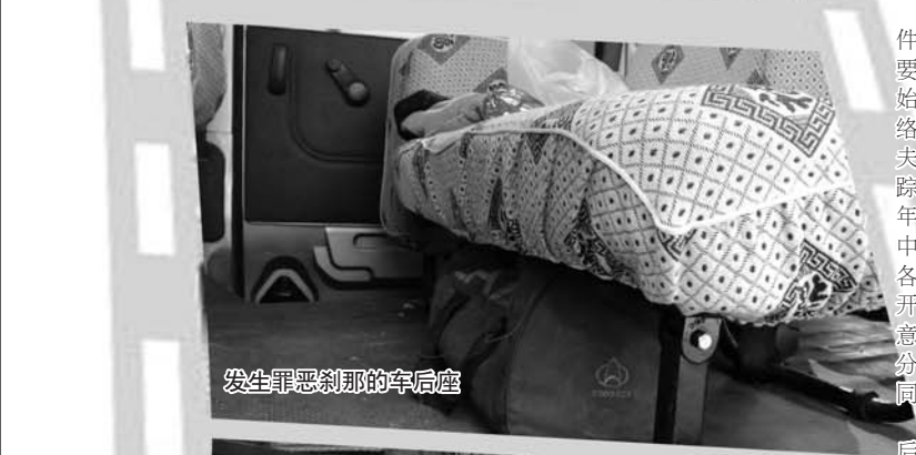
发生罪恶刹那的车后座