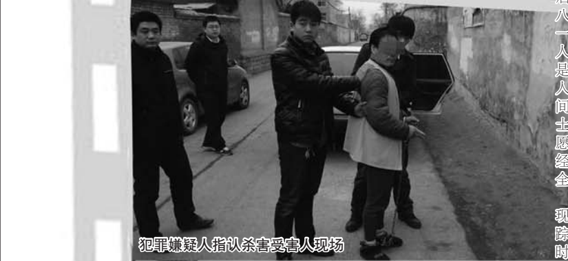
犯罪嫌疑人指认杀害受害人现场