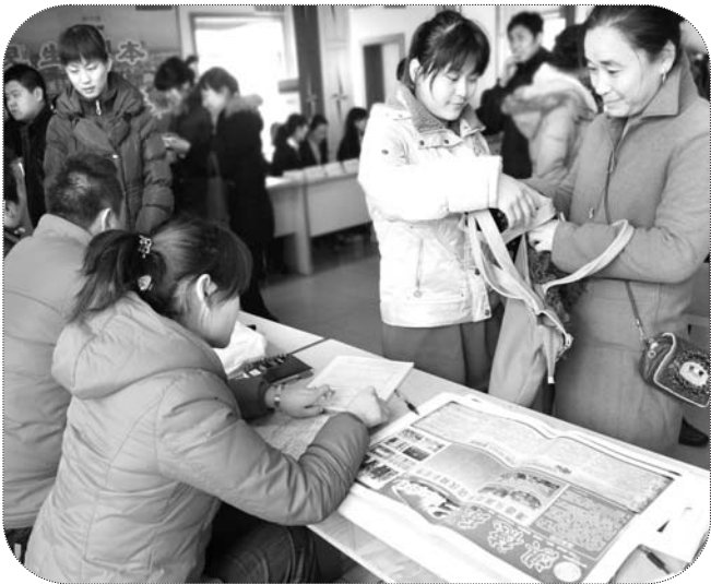
3月8日,一位女生在母亲的陪同下找工作。