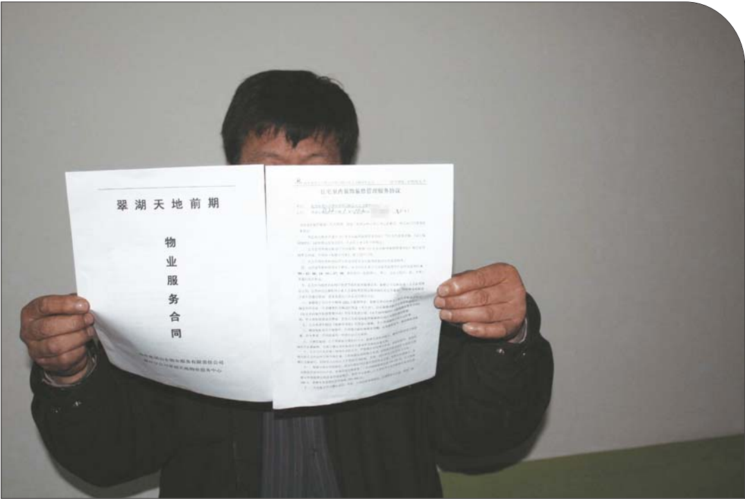
一位业主向记者展示物业服务合同。

滕州市翠湖天地小区近期已经开始办理交房手续,业主在交房时却被该小区物业公司告知,每户需要缴纳2000元钱的装修保证金和200元钱的建筑垃圾清理费,并在一年后检查业主装修合格后,才退还装修保证金。