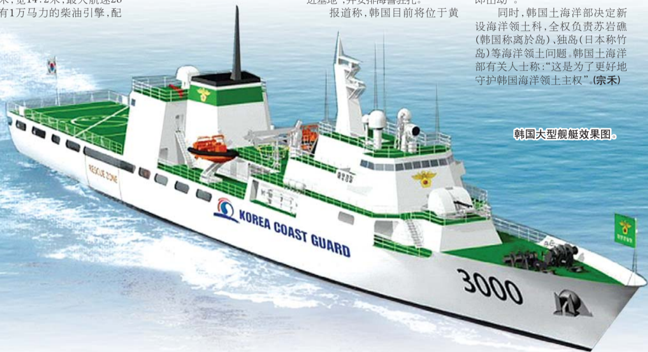
韩国大型舰艇效果图。

金正恩说,陆海空三军官兵要牢记捍卫祖国的神圣责任,随时保持最紧张动员状态。全军要密切注视敌人的一举一动,捍卫社会主义祖国的领空、领土和领海。(宗禾)