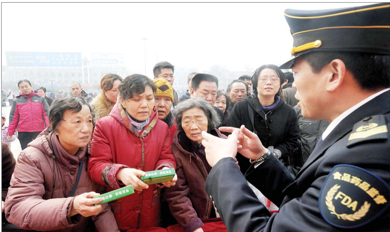
3月15日,由本报张刚大篷车与济南市政府食品安全办公室联合举办的3·15特别活动——“食为天·聚焦食品安全”活动在洪楼广场举办,工作人员向中老年人讲解识别保健品真假的办法。