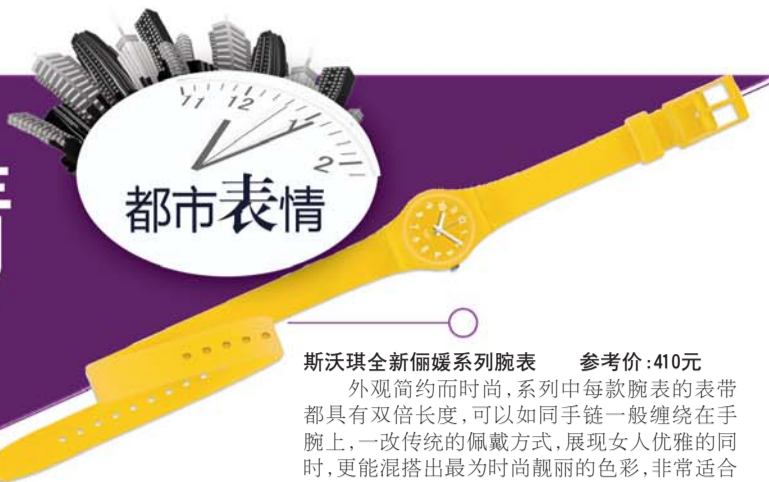
斯沃琪全新丽媛系列腕表 参考价:410元

对于职场精英女性来说,一块与自己身份相符的精致腕表,更能为你平添一份自信的职业魅力。本期我们用三块表定义三种人生阶段,不妨根据自身的年龄气质和消费实力“开架自选”。世间好表千千万,只要适合当下自己的,就是最好的那一款。