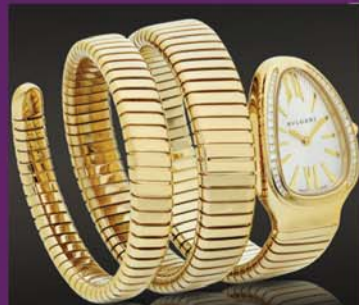
宝格丽黄金蛇形镶钻女表 参考价:295000元

今年日内瓦高级钟表展上,万宝龙展出的摩纳哥格蕾丝王妃系列限量表款可谓巅峰之作,将腕表与珠宝双重制作工艺完美融合,充分展现了万宝龙卓尔不凡的制表工艺,是不可多得的典藏珍品。