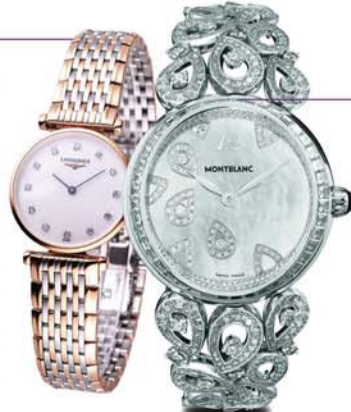
万宝龙摩纳哥格蕾丝王妃系列珠宝腕表 新品未定价

这款浪琴嘉岚系列表拥有超薄圆形粉红色PVD镀层表壳,蓝宝石水晶镜面,表壳造型一如既往的纤薄、时尚,同样没有改变的,还有为这一经典系列赋予不朽魅力的优雅气质。