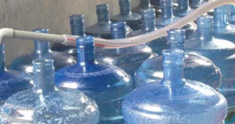
▲桶装水加工点内,设备简陋,卫生不达标。