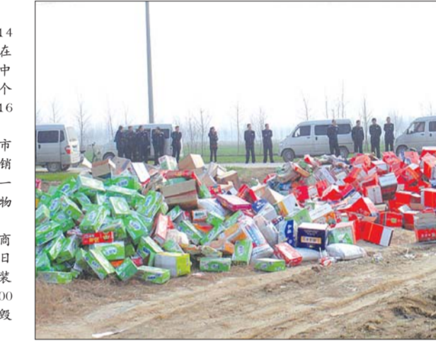
此次公开销毁的假冒伪劣商品主要包含白酒、饮料、食品、日用品、化妆品、种子以及包装物等8大类30余个品种,共计1800件,总价值16万元,是历年来销毁品种最多、价值最高的一次。