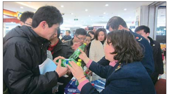
▲在中华路银座商城投诉点,工商人员现场向市民传授鉴别真假商品本领,吸引了大批市民。

牛奶、白酒、碳酸饮料……在中华路银座商城投诉点,工商人员拿着生活中常见的商品,现场为市民一件件传授真假商品辨别方