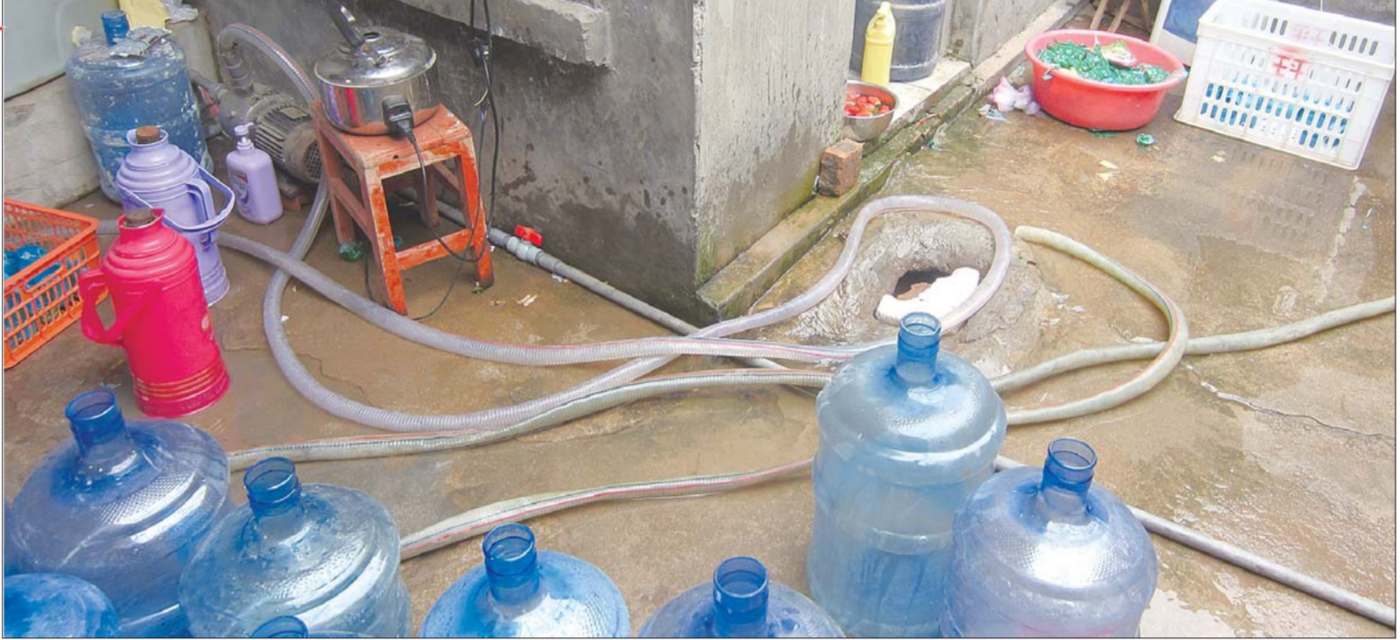
▲经过这根水管,地下水就成了“桶装纯净水”。

质监局工作人员介绍,这些黑水厂为了抢占市场,多以低价出售。按照正常的生产、过滤、净化流程,桶装水能够达标,生产成本在4元左右。但是在调查中,其中一家黑水厂出售的桶装水,零售价格仅为1.1元。有业内人士称,菏泽不少黑水厂,除了零售外还提供灌装业务,只要提供空桶,大批量订水,每桶水的价格仅为5毛钱。