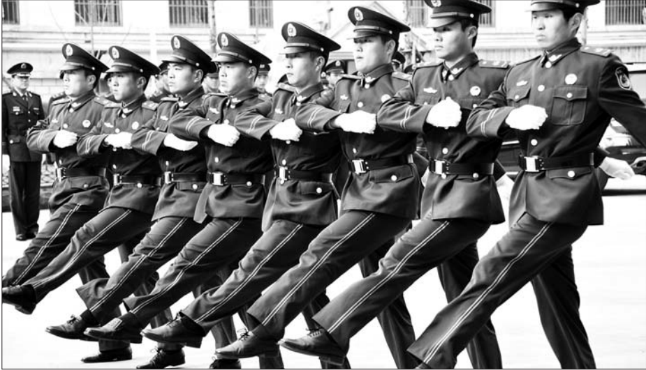
3月30日上午,济宁市消防部队队列会操、内务等比武竞赛在济宁市公安消防支队逐一展开。活动共分队列会操、条令条例暨安全知识竞赛、内务标兵竞赛、安全主题教育板报创作评比四项,全市15个基层中队代表队及135人参加此次比武。 本报记者 韩伟杰 见习记者 庄子帆 通讯员 赵福军 摄影报道

据济宁气象台工作人员介绍,受冷空气影响,从4月1日下午开始,气温逐渐下降。截至2日14时许,气温已从1日午间的20.2℃下降至8.3℃。该工作人员表示,2日夜间最低温度将低至4℃,由于降温幅度大,市民体感普遍会比较冷。但这种低温天气不会持续太久,根据目前的气象监测情况看,从3日下午开始,气温将逐渐回升。