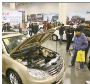
本报曾举办的车展现场热闹非凡。本报记者 赵金阳 摄

同时,全新奥迪A6L(第七代)也将首次亮相烟台春季车展。全新奥迪A6L(第七代)融合完美设计、前瞻科技与尊贵质感于一身,展现奥迪最新科技和未来车型创新的时尚元素,旨在吸引更多追求生活品味和个性的高贵精英。