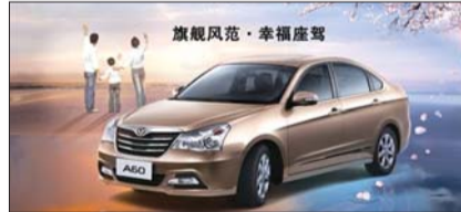
旗舰风范·幸福座驾

东风风神旗下还有S30、H30、H30 CROSS,其中S30融汇了东风40多年整车设计、制造实践及20多年国际合作经验和资源,其安全与燃油经济性更让车主心动。基于“人性、自然、科技”的造车理念,在动力上不仅能够为驾驶者带来激情澎湃的体验,同时突显节能环保的社会利益,在当前油价不断攀升背景下,实在不负“务实英雄”之名。风神S30选用PSA 1.6L发动机,属于目前市场上黄金排量的优化动力系统。这款先进成熟的发动机在5750转时能达到最大功率78KW,升功率达49.15KW。