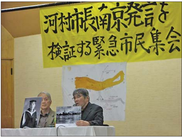
集会现场,名古屋市民陆续发言。据央视

“有30多万”。而《旧金山和约》第11条(战争犯罪)上也清楚记载,“日本国承认了远东国际军事法庭及日本国内及国外的其他联合国战争犯罪法庭的判决”。 这说明,承认了《旧金山和约》,并且认同了关系到“南京大屠杀”的东京审判以及南京军事法庭的判决,日本才能回归国际社会。因此,不承认南京大屠杀牺牲者总数超过30万人,是对国际社会“背信弃义”的行为。 集会的最后,大会代表藤井克彦宣读了“质疑河村市长南京问题发言市民紧急集会”的宣言文草案。草案敦促河村市长撤回错误言论,正视历史事实,促进与南京市的友好关系进一步发展。草案获得与会者一致通过。宣言文已于4月5日向河村市长提交。 据央视