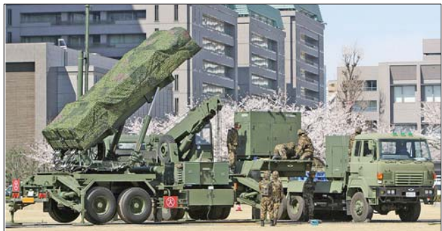
7日,日本在东京部署“爱国者-3”型导弹发射装置。

本报讯 为防备朝鲜发射卫星,日本航空自卫队的“爱国者-3”地对空拦截导弹7日凌晨运抵包括东京市中心的防卫省在内的首都圈3个地点。冲绳县内也已部署4处“爱国者-3”导弹,全国的部署工作至此结束。