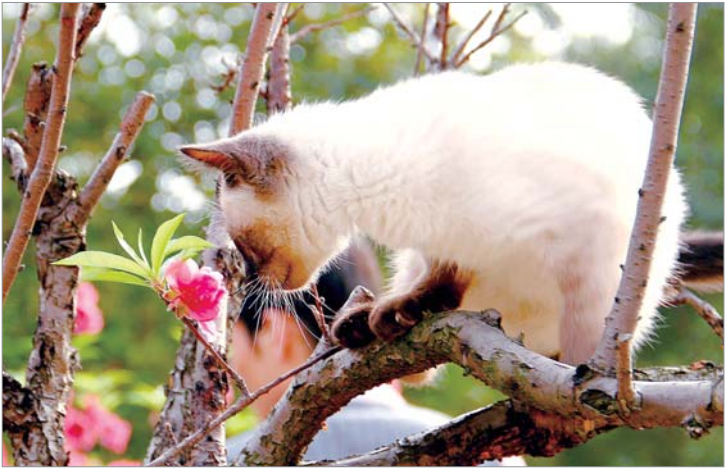
▲我爱花香不爱花。