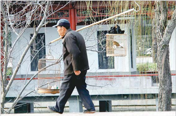
▲一只黄鹂鸣翠柳，两个笼子挑着走。