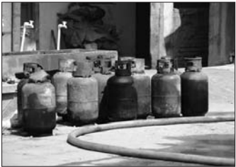
▲消防官兵抢救出的部分煤气罐。