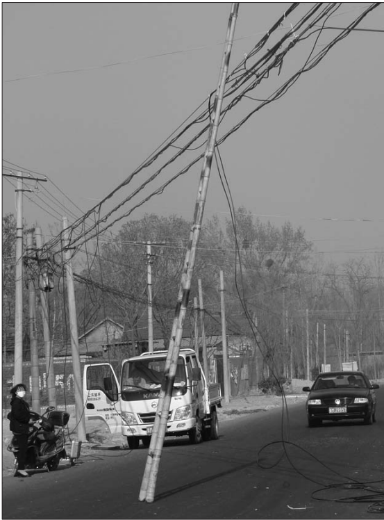
7日,联通公司工作人员正在维修挂断的光缆。

本报4月8日讯(见习记者 杨焕武 张滨滨) 5日晚,市民周先生的妻子高女士骑电动车经过邹平县台子镇院新村时,被垂在半空的联通光缆绊倒摔伤。事后周先生找到光缆所有方台子镇联通公司讨要说法时,该公司一负责人称“联通公司营业机构对此没有直接责任,你们应该抓紧报警,追究挂断光缆的车辆责任”。 周先生的妻子高女士说,5日晚10时许,她骑电动车经过院新村时,被一根低垂在路面中间的光缆勒住肩部,来不及反应的高女士连人带车一起跌倒在地。“我当时感到头晕目眩,半天没缓过神来。”高女士回忆说,“摔得胳膊至今抬不起来,电动车反光镜等部件也摔坏了,出事后这几天我一直在家里休息。” 7日,记者在事发现场看到,肇事的光缆依旧低垂在空中,过往车辆不得不减速绕行。据附近村民介绍,这条光缆可能是几天前被过路的大货车挂断的,刚开始村民担心光缆带电就没人敢碰,整条光缆拦在路上。“光缆掉下来好几天了,不知道为啥一直没有人来修理。”院新村一名村民告诉记者,“5号的时候,联通公司两名人员来现场看了看情况随后就走了,但不知为何之后联通公司一直没有派人前来修理,结果5号晚上就有人被这条光缆绊倒摔伤了。”