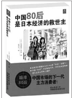
书名:中国80后是日本经济的救世主 作者:(日)原田曜平,余莲 著 赵怡凡 译 出版社:陕西师范大学出版社

本书按照中国80后的消费现状,将80后的消费群体划分为四个类别:月光族、洗炼族、透明族和饭族。又从这四大族群的消费方式与理念入手,对应以日本的商品、文化以及经济的特征,分析了怎样才能够把握住中国的这部分消费群体,并且引用典型(全部为中上等消费群体)的消费实例做了具体的介绍。 本书对于正日益成为中国职场、消费等方面主力的80后人来说,既是直面自己,直面生活,更是直面世界的一个重要参考;在正确认识自己的同时,也必定能够通过本书感受到自己对中国经济,对邻国(如日本)经济,甚至是世界经济所起的重要影响,从而树立起中国80后强大的自信心。 此外,该书对日本企业提出的诸多针对中国80后人群消费观而需要制定的经营策略,也为中国企业的发展走向开