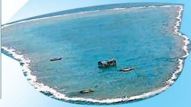
日本提出申请的7个海域。

[实力主流品牌联袂打造] 订制版路线 行程丰富 领略美澳全貌 浸泡式英语学习 与国外校方紧密互动 高性价比 良好的签证记录 未来就读与生活规划 美国线、澳洲线持续火爆,本报应广大家长要求,再推特色美国游学营。请家长、学生及时预约!