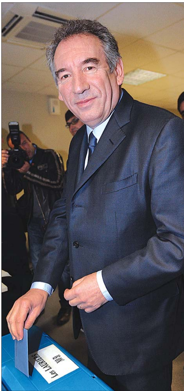
法国中间派政党民主运动主席贝鲁。

她说,将召集国民阵线成员、前人民运动联盟成员和其他爱国人士,组建“海军蓝色组织”,从而在6月的议会选举中取得更多议席。勒庞希望取得15个议席,达到组成议会党团的资格,进而在立法过程中掌握更多发言权,为进军2017年总统选举铺路。