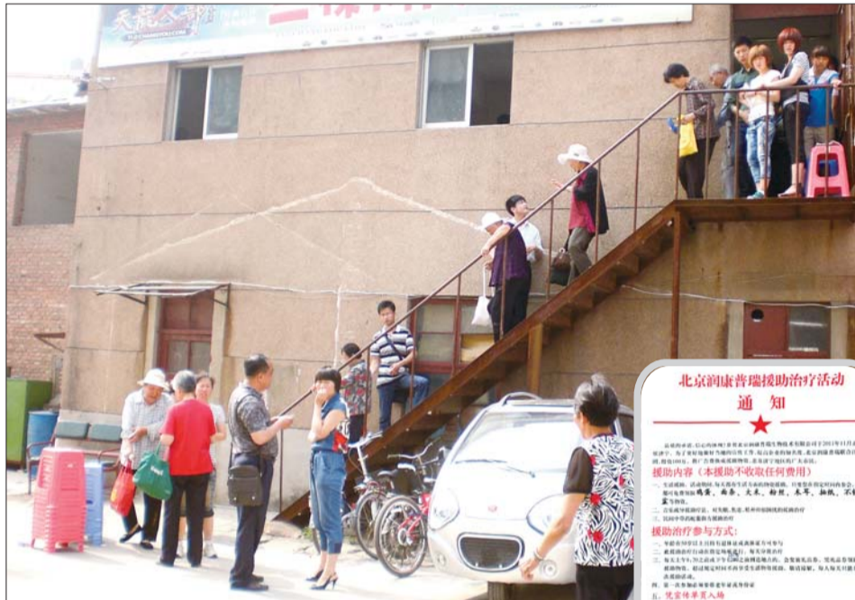
▲听课的老年人从教室里走出。▶该公司的活动文件。

市民李老太太今年66岁,接到传单后她早上7点就来了,领了一包酱油开始听课喝茶。“一人一杯茶,老师就讲喝茶的好处,我是第一次上课,没有买过茶。”而从去年就开始听“喝茶课”的张老太太说,自己已经买了6盒保健茶,“一盒498块钱,里