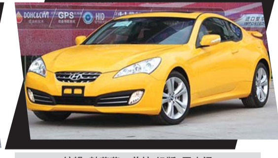
编辑:韩英英 美编/组版:王小涵