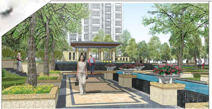
弘盛现代城景观图。

泰安弘盛现代城位于南湖公园西南方向200米旧镇社区。距火车站有五分钟的车程,打车起步价即到,长途汽车站近在咫尺。项目位于灵山大街南湖大街以南、青年路以西、南外环以北的地段,周边交通便利,四通八达10分钟生活圈,区内配套完善,公交车有5路、29路、11路等。