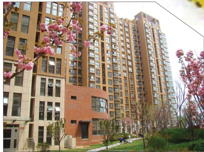
安居·上上城现房实景图。

安居·上上城由泰安市安居房地产有限公司开发建设,位于天烛峰路与规划五马路交汇处,总建筑面积约15万平方米,绿地率高达45%以上,规划建设高层住宅、多层住宅、花园洋房,同时建有幼儿园、会所、商业街以及地下车库,建成后将成为泰城东部集休闲娱乐为一体的高品质居住区。