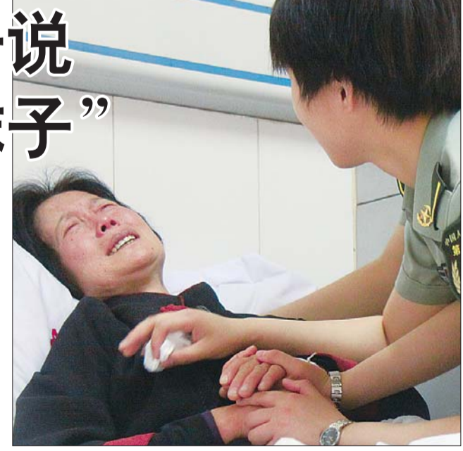
14日,在潍坊市益都中心医院,沈母悲痛不已。

沈星从小就很懂事,沈希望说,沈星都上高中了,还在帮自己捡瓜皮喂猪,“在村里,初中的孩子去捡瓜皮都嫌掉价,我儿子不嫌!”