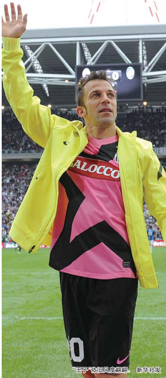
“王子”依旧风度翩翩。

因扎吉透露,自己将会在未来几天思考清楚后决定去向,他不希望9号战袍被封存,“退役?放弃足球对我来说太难了,我需要几天时间来作出决定。封存9号?我觉得这不公平,因为在我之前还有巴斯滕和维阿这样伟大的球员也穿过这身球衣,我希望9号的荣誉能够继续下去,希望身穿这件战袍的人都能为荣誉、尊严以及这红黑两色而奋斗。”(阿易)