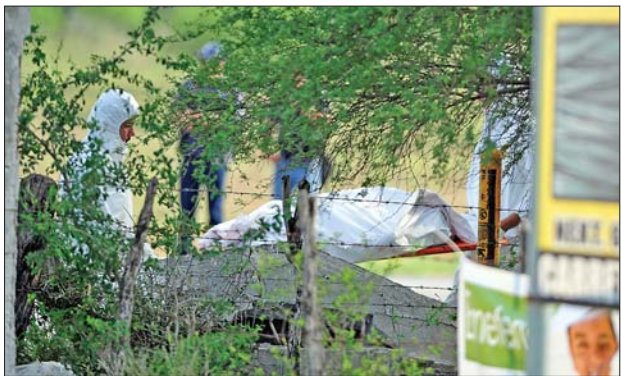
左图:5月13日,警方在事发现场调查。