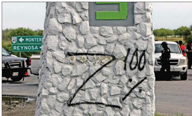
右图:这是5月13日在犯罪现场附近拍摄的“Z100%”字样涂鸦。“Z”是代表涉毒暴力集团“塞塔”的标记。