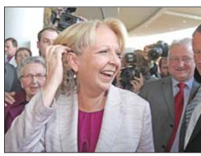
北威州州长克拉夫特

和12.1%;基民盟得票率仅为25.7%,大大低于选前民调中30%的支持率。现任州长、社民党人克拉夫特女士成功连任。