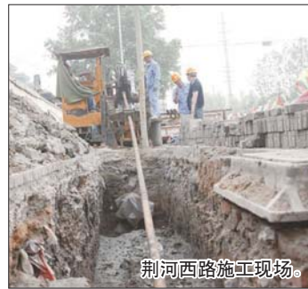
荆河西路施工现场。

案,荆河西路管段完成改造施工后,滕州华润燃气有限公司将沿荆河路向东推进,计划年内完成荆河路3200余米改造任务。然后沿善国路向北,逐步将全市20余公里的老旧管网分期分批改造,使城区天然气管网运行工况更为优化,市民用气更加顺畅。改造施工将全部采用非开挖定向穿越施工敷设新的PE管道,尽可能的减少因施工给市民生活带来的不便。