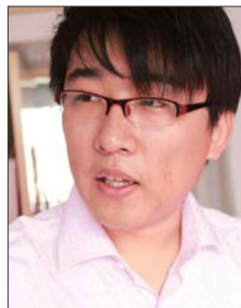
设计师:刁志鹏 业之峰装饰德州分公司

本案业主为商业成功人士,在交流过程中,表现出极高的品味,喜欢欧式沉稳大气的风格,但不喜欢过于复杂的线条与花纹的壁纸,要求最后的效果要有家的感觉而不是酒店大堂。