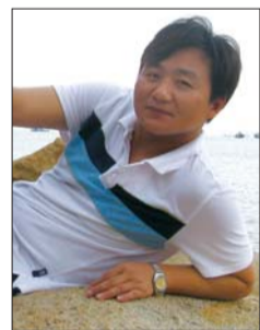
设计师:黄家红 广东星艺装饰(集团)德州公司

现代简约风格主要以简洁、大方为主,结合当地的气候,所以整个一楼的墙面用仿大理石砖,这样整个效果显得大方、稳重,同时也能体现主人的性格特征,同时墙面用一些雕花镜处理,这样可以使得整个空间更大,同时还具有一点灵气。