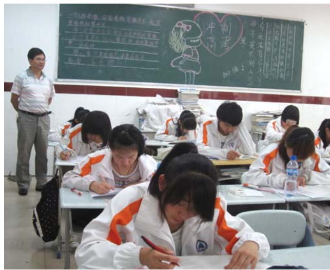
24日,泰山中学高三学生参加第三次模拟考试。

“学习不好的学生如果掌握技术娴熟,同样可以上大专。县市区中等职业学校每年只需交100元就能上学学技术,一般学校跟厂家都有协议,三年后直接参加工作。”泰安市文化产业中等专科学校招生办老师说。