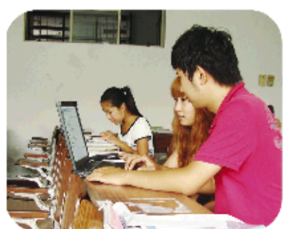
▲wlan日在大学校园普及

在青岛,无线宽带(WLAN)接入点已达7.5万个,覆盖1.5万余座楼宇和主要公共场所。今年,金沙湾海水浴场在原有WLAN基础上,到年底,青岛的四个海水浴场均实现WLAN上