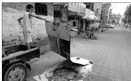
一个污水井盖缺失了两个多月。 地点:济南山大路27号门前