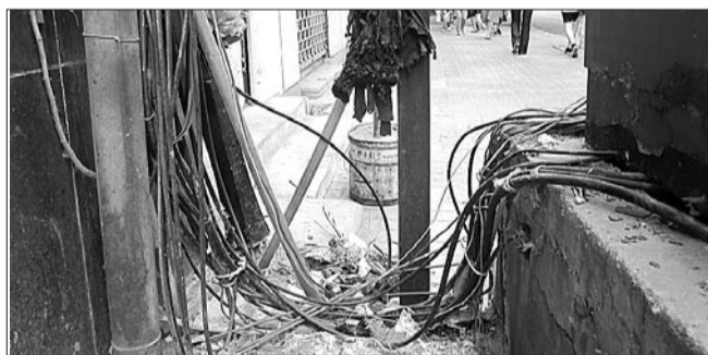
配电箱线缆凌乱。 地点:济南历山东路