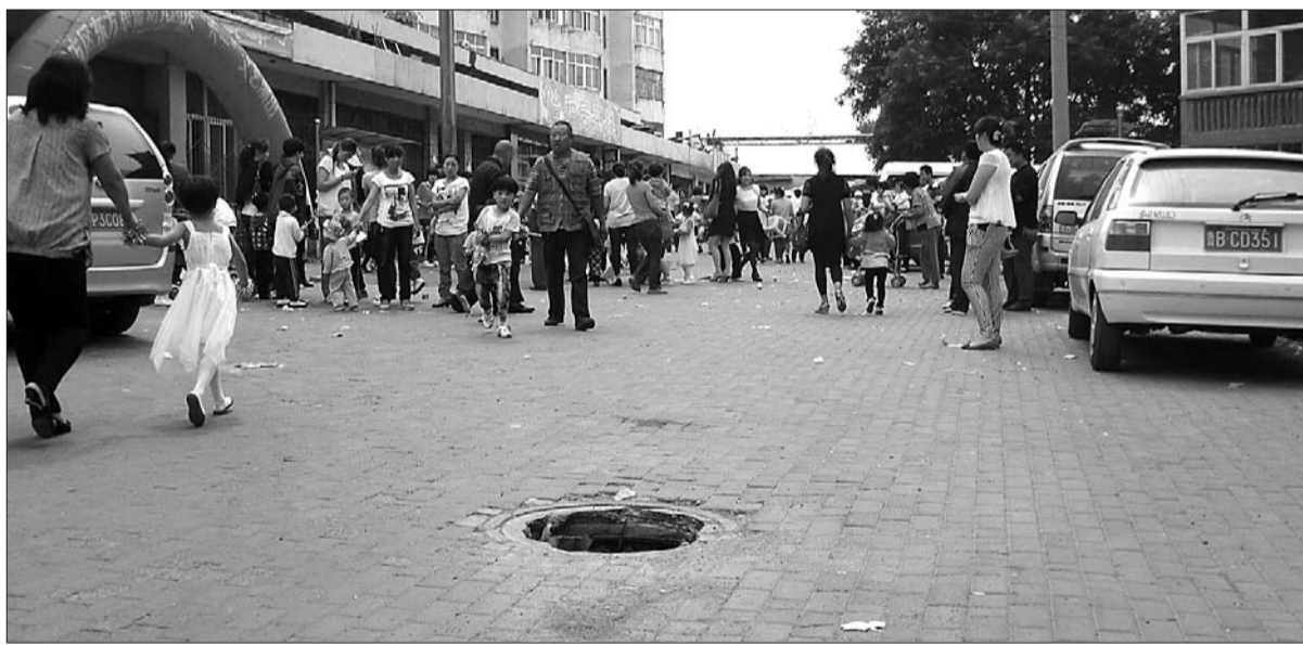
一个污水井盖缺失了两个多月,很多人避而远之。 地点:青岛郑州路社区办公室前小广场