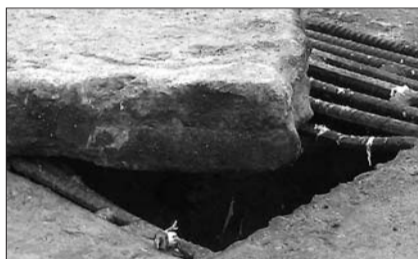
一个井盖丢了大半部分,用一块石头压在缺口。 地点:曲阜书院街与城隍庙街交会处