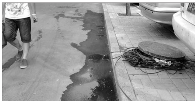
一个井盖“张着嘴”,里面凌乱地塞满了线缆。 地点:济南花园路与花园庄东路交叉口西侧